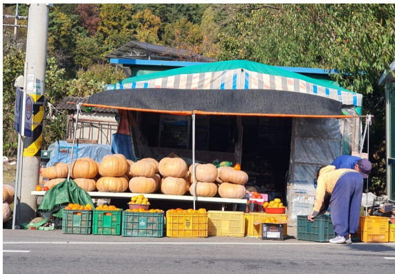
[그림 1] 호박, 감, 모과 등 매대

‘선물’이라는 관점을 본격적으로 다루기에 앞서 점방에서 농산물들이 소비 혹은 교환되고 있는 방식에 대해 간략히 정리해보고자 한다. 아래 사진에서 보드시피 농촌의 몇몇 마을 점방들은 매우 작은 규모라 하더라도 일종의 로컬시장 기능을 수행하고 있었다. 혹 다른 주민들의 생산물을 팔아주는 매대의 역할을 하지 않으면 자신들이 생산한 물품들을 점방에서 소비하는 형태로 생산과 유통이 결합해 있는 식이다.