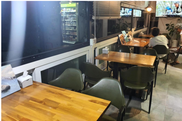
[그림 6] 산내 CU 편의점 내부

어 있다. 쌀빵 가게 입구에는 파라솔과 나무 탁자들이 놓여 있어 동네 주민들이나 물건을 구매하러 온 손님들이 앉아있는 모습들을 종종 관찰할 수 있었다. 산내 편의점에는 아예 강이 바라다보이는 전망 좋은 한쪽 측면을 통째로 손님들을 위해 만들어두었다. 사진에서 보다시피 실내 공간에는 TV도 비치되어 있고 탁자도 여러 개 있으며, 옥상에는 산과 강을 보면서 맥주를 마실 수 있는 공간이 별도로 존재한다. 주민들은 이곳에서 밤에는 술을 마시기도 하고, 학교 끝난 아이들이 부모를 기다리면서 간식을 까먹고 친구들과 놀거나 컵라면을 먹으며 시간을 죽이기도 했다. 이와 같은 공간배치는 O 슈퍼, U 슈퍼, A 점포 등에서도 일관되게 관찰할 수 있는 사회적 교제의 공간 - 마루, 평상 등 - 과 겹쳐진다(사진 참조).