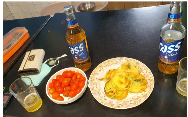
[그림 2] 점방 텃밭 작물로 만든 안주들

[그림 1]은 도로변의 한 점방인데 가을 수확 철이라 매대에 작물들이 가득하다. 평상 위의 호박은 점방 주인의 해남 사는 친구가 밭에서 키운 것을 트럭으로 실어왔다고 했고, 감과 모과 등은 본인 밭에서 난 것을 포함해 동네 주민들이 갖다 놓은 것이라고 했다. 가을철이 아니면 이 가게는 감식초나 집에서 만든 효소, 소포장