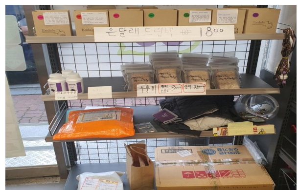
[그림 5] 산내 CU 편의점. 입구 바로 옆에 지역 생산품들을 위한 매대가 비치되어 있다. 매대 하단에는 주민들의 택배를 대신 맡아두는 공간도 마련되어 있다.