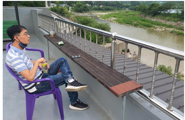
[그림 7] 편의점 옥상 루프탑 공간

반면 남원지역 N 생협의 경우, 자사 유통브랜드 지역조합 직영 매장을 개설하기 전과 이후 공간의 변천을 살펴볼 때 공간 구성의 차이가 뚜렷하다. 매장 개설 전 지역조합이 농림부에서 예산 지원을 받아 남원 광한루 근처 소규모 매장 겸 사무실에서 조합 활동을 할 때는 물건을 사러 온 사람들이 모여 차를 마시거나 막걸리를 한잔하고 가거나 하는 길쭉한 테이블이 공간 정중앙에 자리 잡고 있었다. 지역조합이 N 생협 브랜드를 달고 직영으로 본격적인 매장사업을 시작한 2기에는 해당 생협 물품들을 중심으로 매대 구성이 되어있고, 더 체계적인 진열이 가능했다. 하지만 매대는 어른들의 가슴높이보다 낮았고, 장을 보러오는 사람들은 반대편에 있는 이의 얼굴을 볼 수 있는 구조다. 매장 내부에는 원형 테이블 3개와 창가 탁자가 놓여 이곳에서 아이들이 장 보는 엄마를 기다리거나 피자를 먹기도 하고, 아이들이 간식을